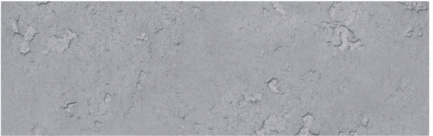
CONCRETE GROSSO CLOUDY