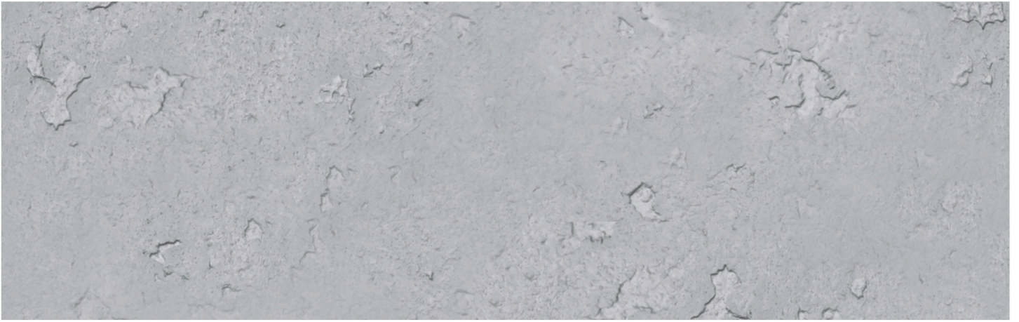
CONCRETE GROSSO SILVER