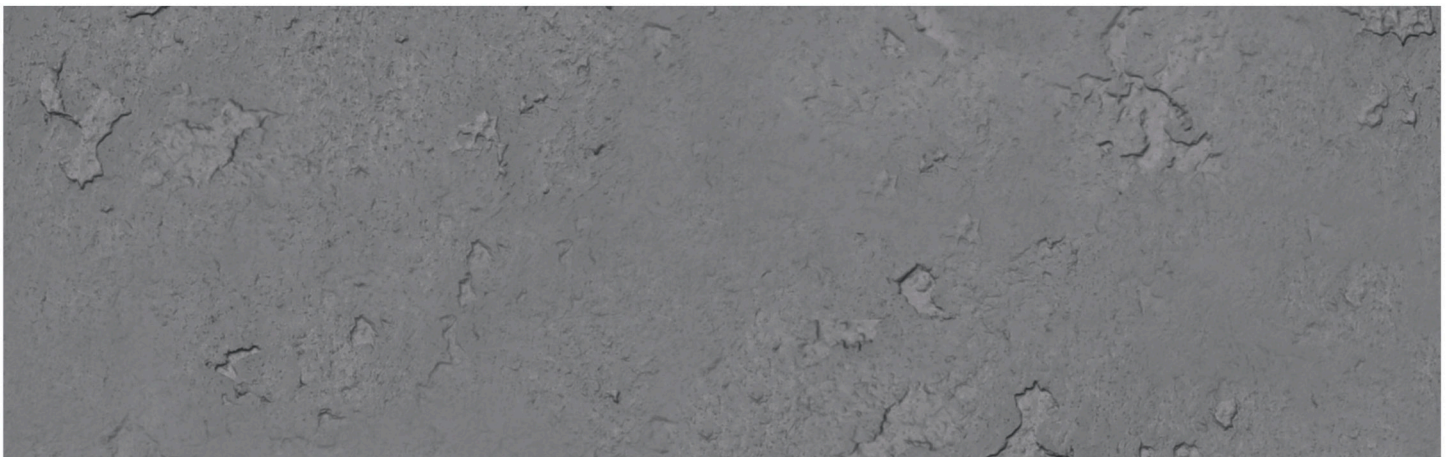
CONCRETE GROSSO GRAY