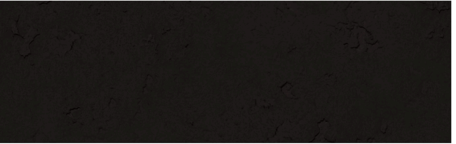
CONCRETE GROSSO BLACK