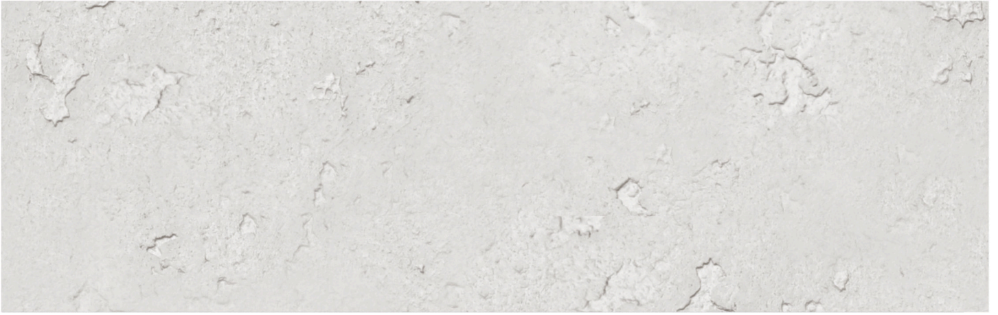
CONCRETE GROSSO CHALK