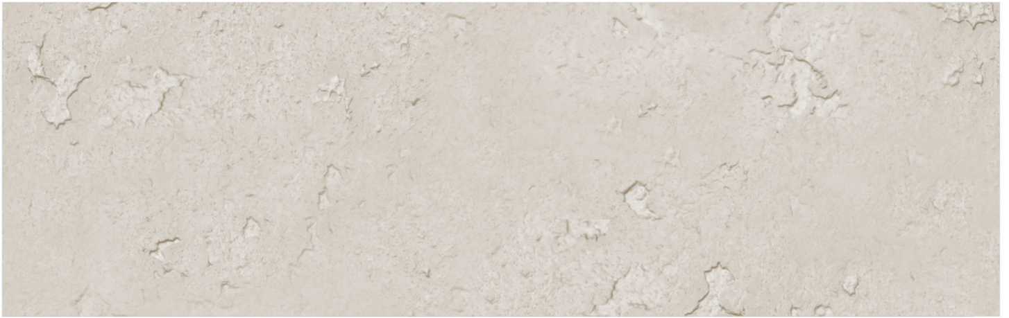
CONCRETE GROSSO CREAM