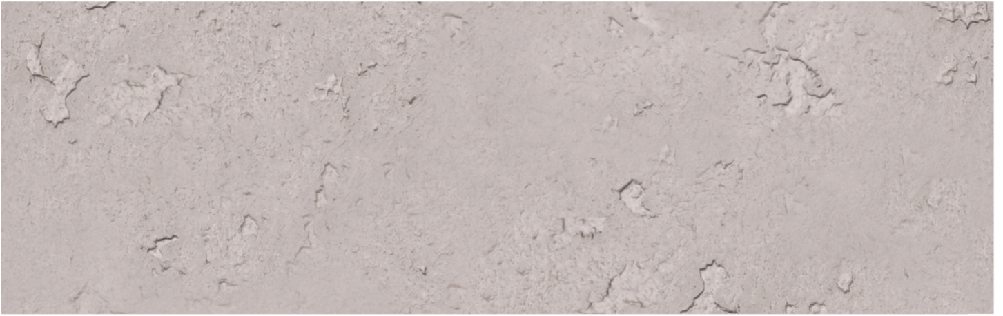
CONCRETE GROSSO MIST