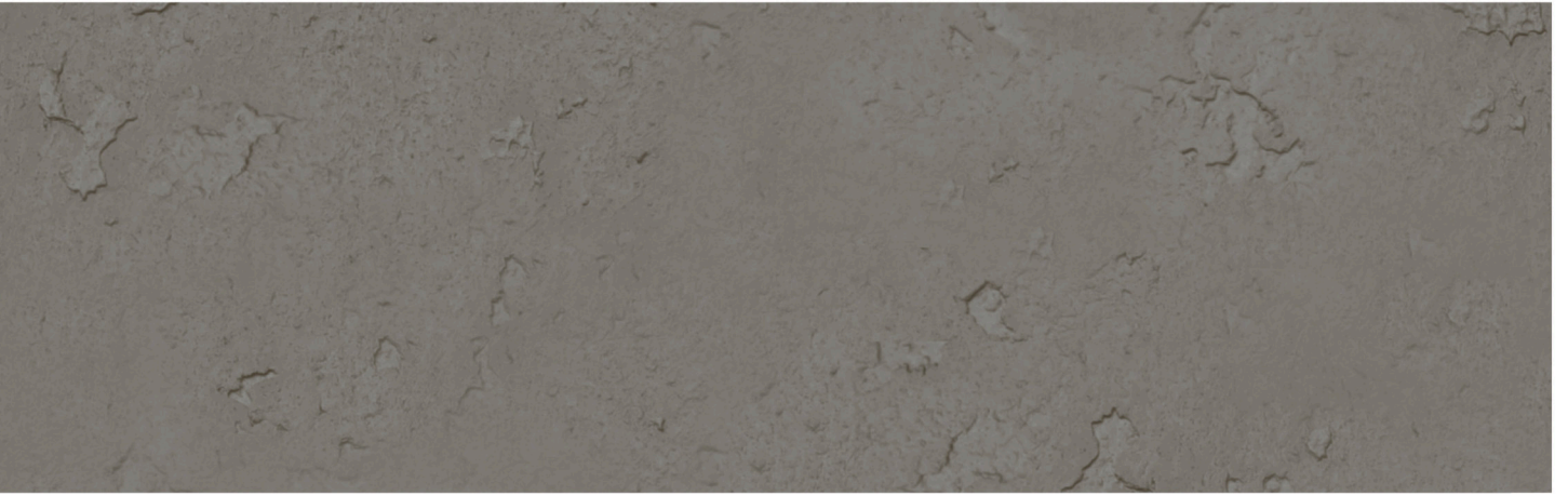
CONCRETE GROSSO CEMENT