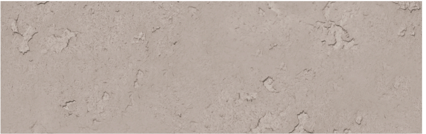
CONCRETE GROSSO LATTE