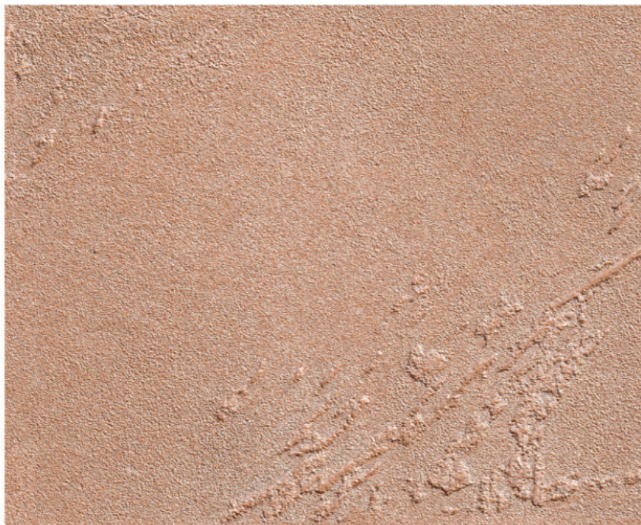
Cebolron Cromo 227/2 su CeboStrong