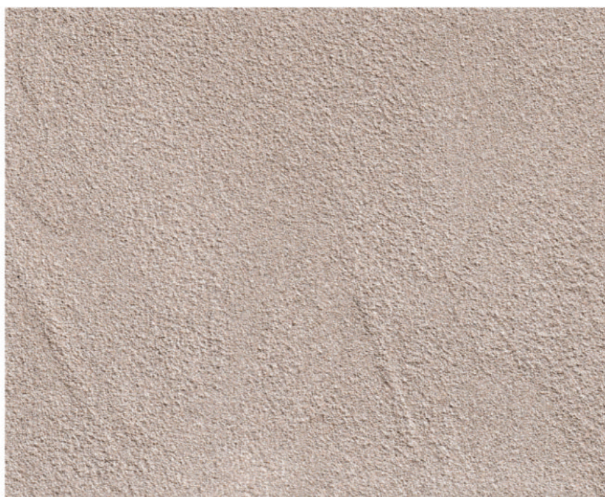
Cebolron Cromo 233/1 su CeboStrong